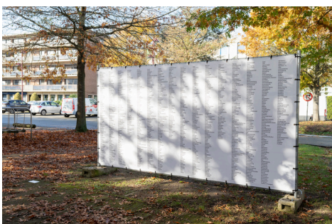
PARKING WAALVEST 7032 km